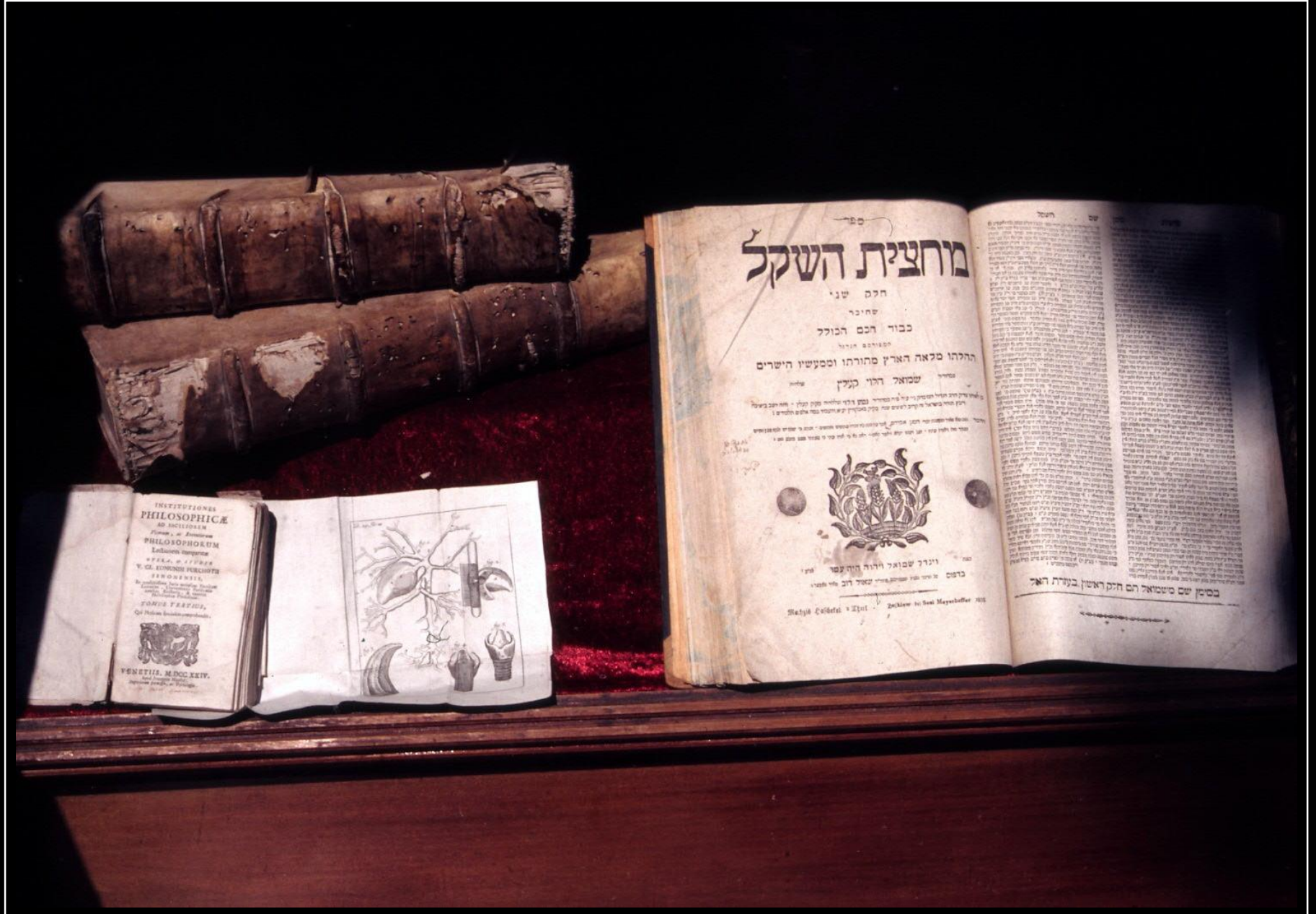
© Das Buch Deines Lebens ist schon längst geschrieben. Entscheide Du, wie es zu lesen ist. ☺ Sehr alte, schwer lesbare Bücher werden in einer Ladenvitrine in der Fußgängerzone von Belgrad zur Schau gestellt - Juni 2007